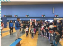
“运动员伙伴计划”，OnBoard For Good Limited 在香港体育学院(HKSI)统筹体育活动