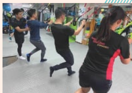
在运动伸展治疗中心指导伸展方法

核心科目PE56253「体育产业的体验式学习」为学生提供在运动及体育相关的非政府组织 (NGO) 和私营公司等机构的实习机会。